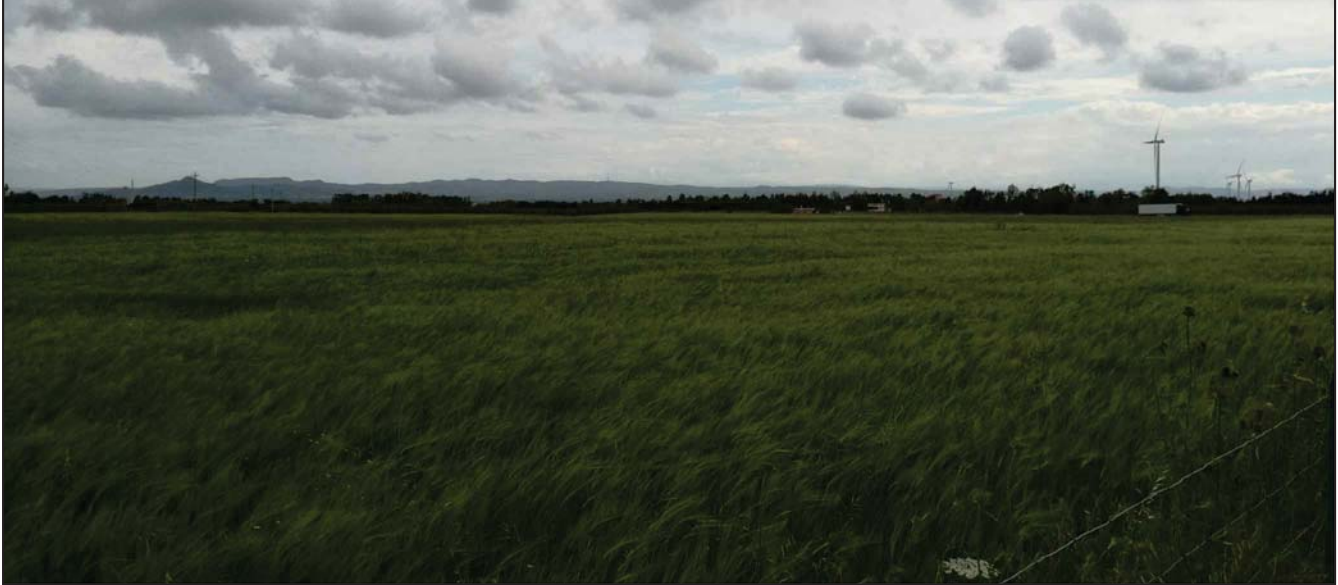
VISTA AREA INTERVENTO (FOTO 2)