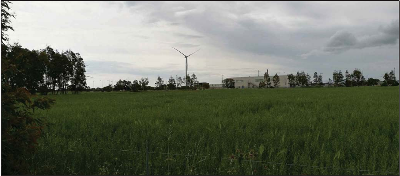
VISTA AREA INTERVENTO (FOTO 3)