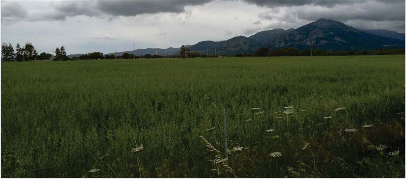
VISTA AREA INTERVENTO (FOTO 1)